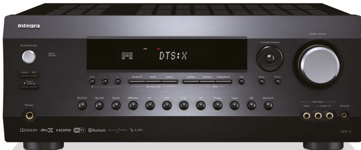
* Изображение ресивера после обновления ПО для декодирования DTS:X

Оснащенный функциями стриминга нового поколения на базе приложений, 6G видео и объектно-ориентированным окружающим звуком, а также бесшовным управлением развлечениями в масштабе всего дома, новый A/V ресивер Integra DRX-2 готов к будущему.