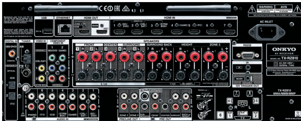
Текст на ресивере может отличаться в зависимости от региона.