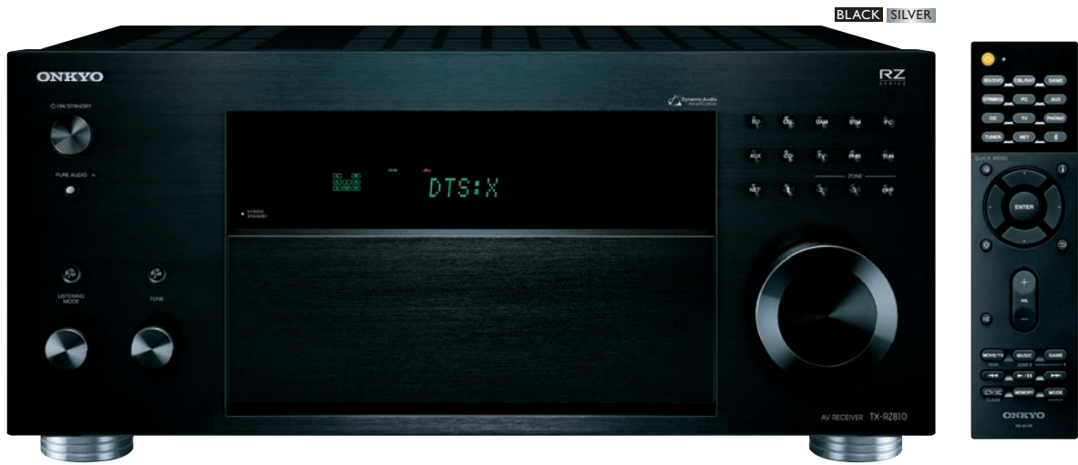
* Изображение ресивера после обновления ПО для декодирования DTS:X