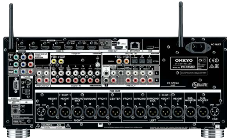
Текст на ресивере может отличаться в зависимости от региона.